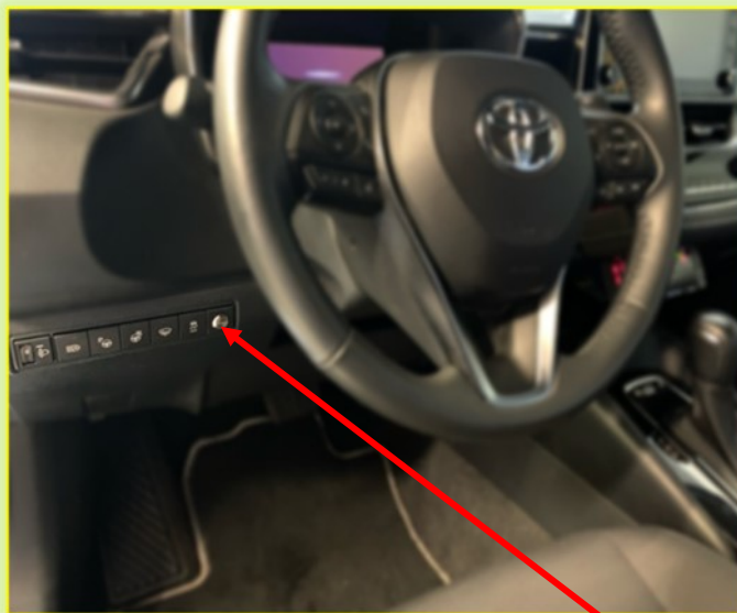
Schalter für Dachzeichen EIN/AUS