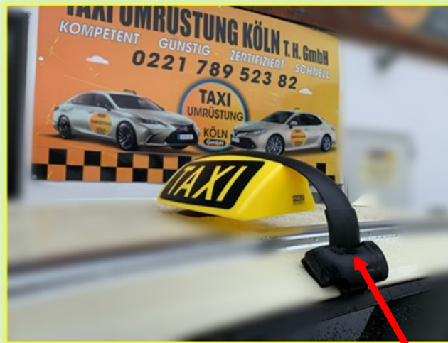
Halterung für HALE Dachzeichen (TRS-AB21)